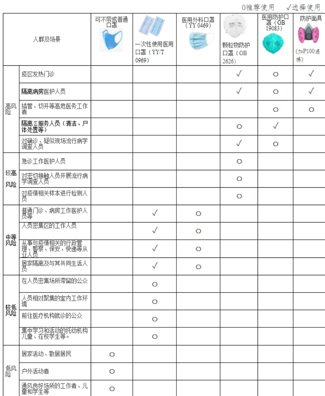
附表：口罩类型及推荐使用人群